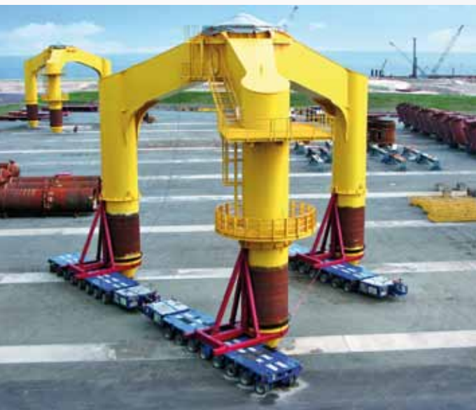
Sicher ins Ziel mit easyTrack – Krantransport mit selbstfahrendem Schwerlasttransporter mit einem Lenkeinschlag von +/- 135°.

Kontakt RZI Software GmbH, siehe Hefrückseite.